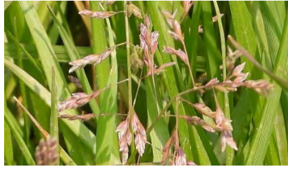
スズメノカタビラ(花)