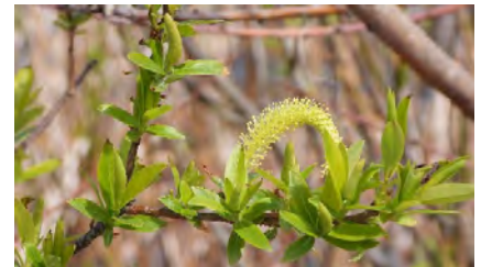
タチヤナギ(雄花序)