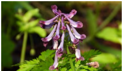
ムラサキケマン(花)