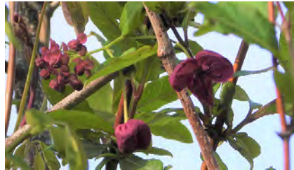
ミツバアケビ(花序)