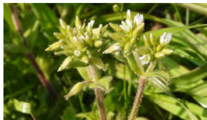
オランダミミナグサ(花)