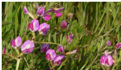
ヤハズエンドウ(花)