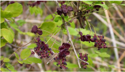
ゴヨウアケビ(花序)