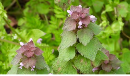
ヒメオドリコソウ(花)