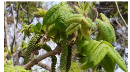
オニグルミ(雄花序)