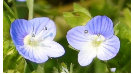
オオイヌノフグリ(花)