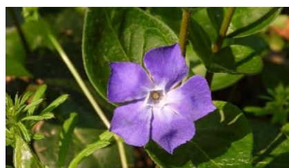
ツルニチニチソウ(花)