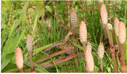
スギナ(孢子茎はツクシ)