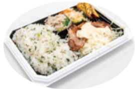
◀ 1月28日～2月3日に販売されたお弁当

初日のこの日は販売前から行列ができ、児童の販売開始の合図が出ると15分ほどで完売しました。