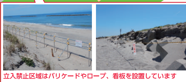
立入禁止区域はバリケードやロープ、看板を設置しています