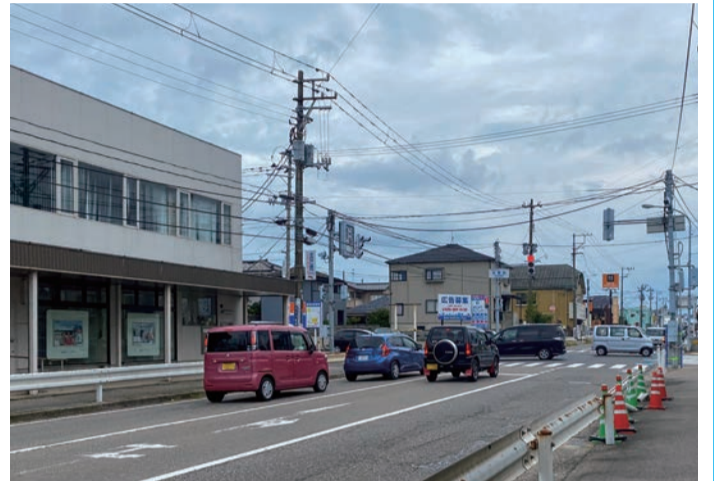
交通規制見直し前の寺尾西交差点(小針・青山方面)