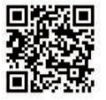
窓口混雑状況 ホームページ