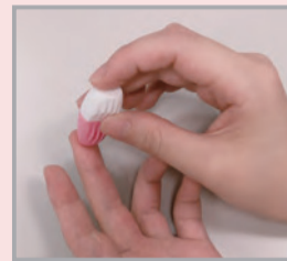
専用の器具で指に針を刺します