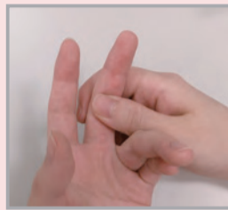
採血する指を圧迫します