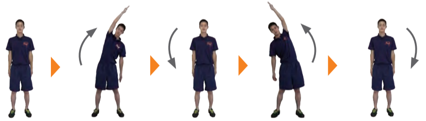
腕を横から上に振り上げて体を曲げる。脇腹の筋肉が伸びたら、腕を戻しながら元の位置へ(2回繰り返す)