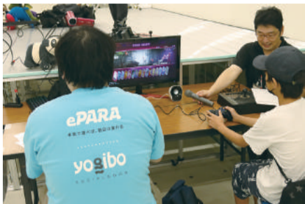
全盲のゲーマーと格闘ゲーム対戦