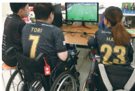
プロゲーマーと車いすユーザーがチームになってサッカーゲーム