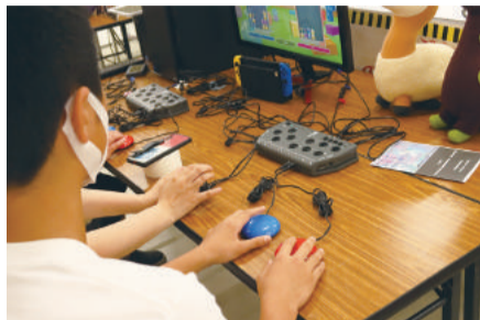
フレックスコントローラを利用したパズルゲーム体験

子どもたちにとって身近なeスポーツを通じて、障がいがある人の暮らしを考えることにより、学校の教室でしか福祉に触れたことがない子どもたちが、実際に障がいがある人と喜怒哀楽を共有することで、活きた福祉教育を体験することができました。機器の工夫だけでなく、一緒に楽しもうという「心のバリアフリー」があふれる空間でした。