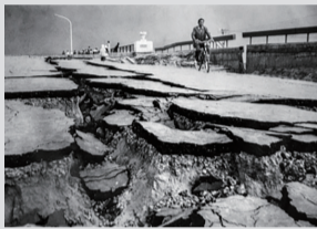
昭和大橋地割れする