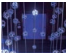
新潟大学工学部 アート作品