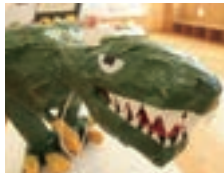
自由研究優秀作品