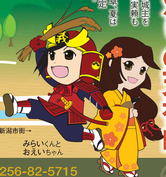
みらいくんとおえいちゃん