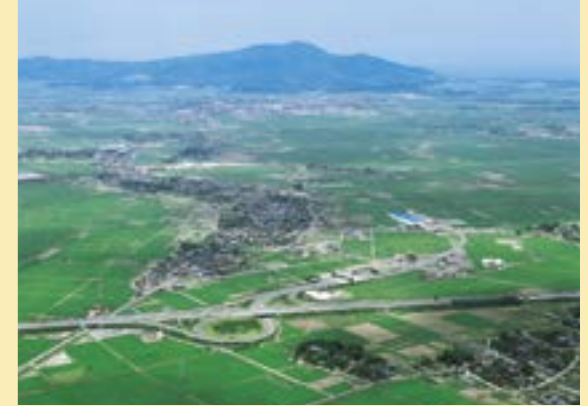
西蒲区の玄関口のひとつが、北陸自動車道「巻潟東I.C.」。国道460号を介して国道116号・国道8号とつながっています。

【西蒲区のデータ】 ●人口 59,478人 ●世帯数 20,132世帯 ●面積 176.51km 2 *人口・世帯数は住民基本台帳(平成27年12月末)による