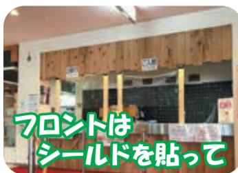
フロントはシールドを貼って