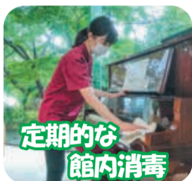
定期的な館内消毒