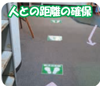
人との距離の確保

新型コロナウイルスの感染を防止するためには、一人ひとりの感染予防が極めて重要です。「人との間隔はできるだけ2m以上空ける」、「近い距離で人と会話する際はマスクを着用する」、「こまめな手洗い・手指消毒」など、新型コロナウイルスにかからない・うつさないことを強く意識しましょう。