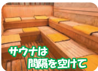
サウナは間隔を空けて