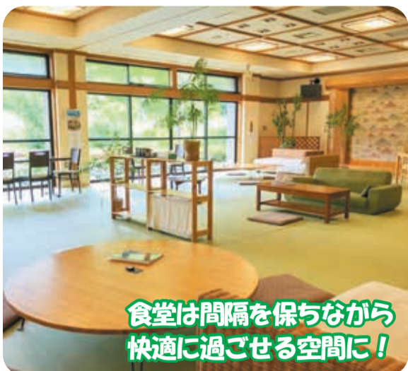
食堂は間隔を保ちながら快適に過ごせる空間に！

電話：0256-72-4126 所在地：新潟市西蒲区福井4067 ホームページ：https://www.jonnobi.com/