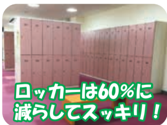
ロッカーは60%に減らしてスッキリ！