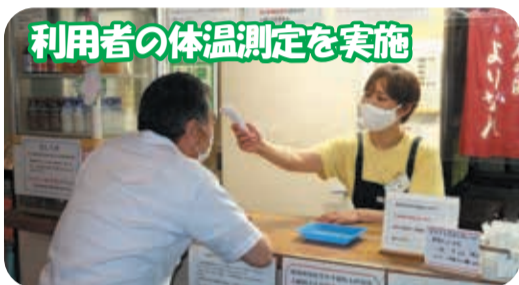
利用者の体温測定を実施

※混雑する場合は入場を制限することがあります 電話：0256-82-5870 所在地：新潟市西蒲区石瀬3331-1 ホームページ：http://yorinare.com/