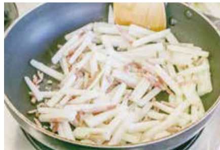
大根が少し透明になるまで炒める