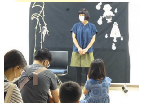
スペシャルおはなし会の様子