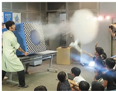
らんま先生 空気砲の実演