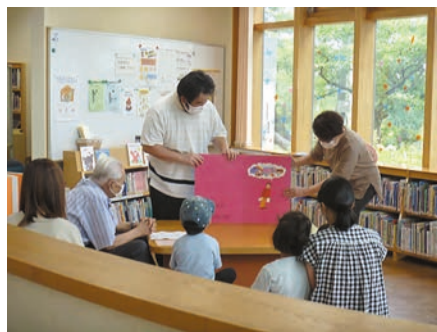
おはなし会の様子