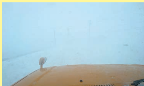
地吹雪発生時の車内からの視界

過去の状況を踏まえ、地吹雪で立ち往生した箇所や一時通行止めにした箇所には、地吹雪発生時通行注意の看板を設置しています。通行の際は注意してください。