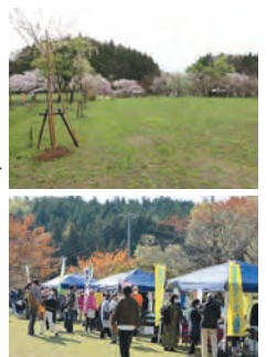
▲矢垂の郷フェスタ