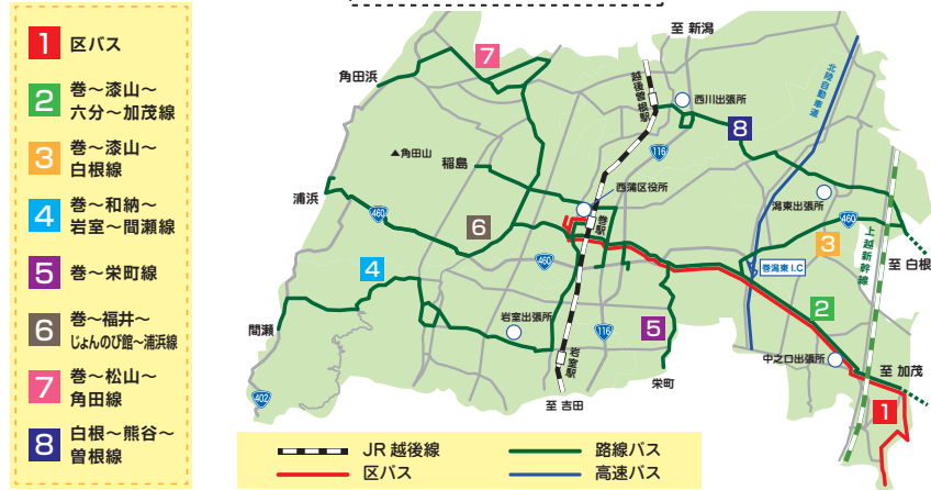
西蒲区公共交通マップ

夏休み期間は、子どもワンコインバス(小学生以下1乗車50円)やシルバーチケット(65歳以上運賃半額)を使って、お得に公共交通を利用しませんか。 ※子どもワンコインバスについては、同日発行の市報にいがた 別冊情報ひろば(P4)をご覧ください