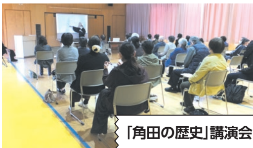
「角田の歴史」講演会

「浜の記憶」記録プロジェクト、地域福祉の充実、地域を花で飾り隊、環境保護対策など