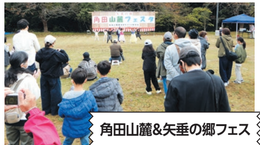
角田山麓&矢垂の郷フェス

角田山麓&矢垂の郷フェス、いきいき健康づくり、カーリンコン競技、健康づくり教室など