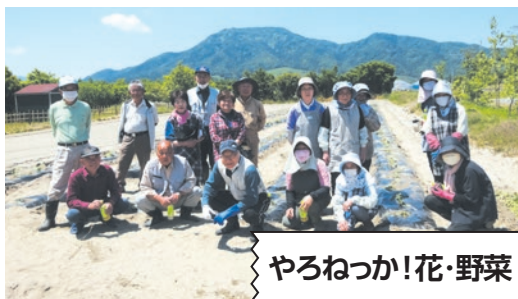
やろねっか!花・野菜

所在地 西蒲区松野尾2852-3(コミュニティセンター内) ☎ 0256-78-8893