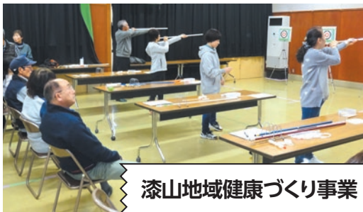
漆山地域健康づくり事業