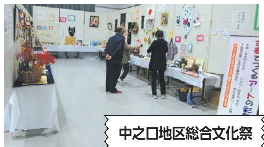
中之口地区総合文化祭

所在地 西蒲区中之口626(コミュニティセンター内) ☎ 025-201-9399