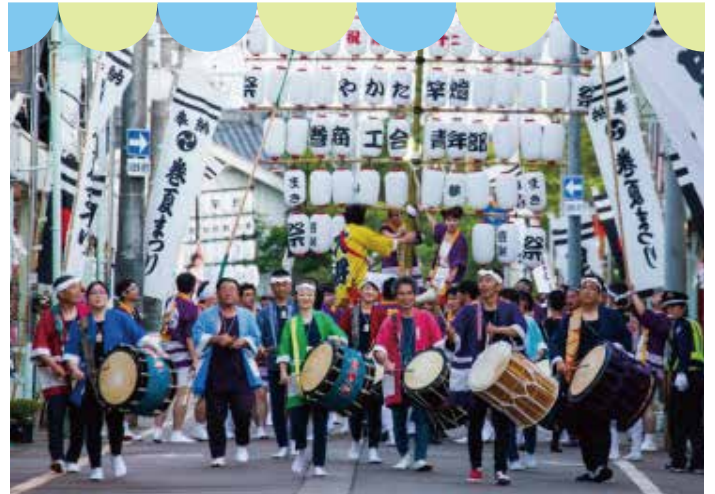
▲やかた竿燈・越王太鼓

西蒲区では、夏の訪れを告げる「まき夏まつり」に合わせ、区の一体感醸成を目的としたパレードを開催します。地域の伝統文化を生かしたパレードに加え、ミッキー・マウスをはじめとしたディズニーの仲間たちも出演します。西蒲区内の地域伝統文化と、ディズニーによる心躍る愉快で楽しいパレードをぜひご覧ください。