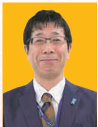
西蒲区長 堀 峰一