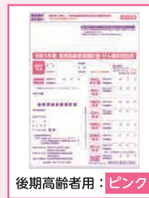
後期高齢者用：ピンク