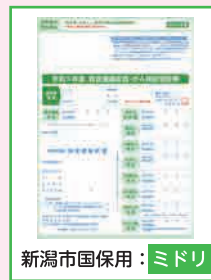
新潟市国保用：ミドリ

加入中の 健康保険証 により、 受診券が異なります 。保険証と色が合っているか確認してください。