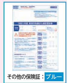
その他の保険証：ブルー