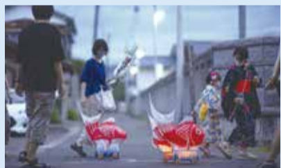
▲昨年の鯛の盆の様子

JR巻駅周辺の26自治会で構成しています。部会は9つあり、各種のイベントを開催しています。健康・福祉・環境・防犯防災などの課題について地域の皆さんと一緒に考え、さまざまな取り組みを行っています。