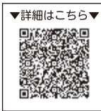
▼詳細はこちら▼ ▼朝妻副市長・堀区長(上段)も一緒に黒湯を応援

場 岩室温泉旅館組合(岩室観光施設いわむろや内) (☎0256-82-1066)