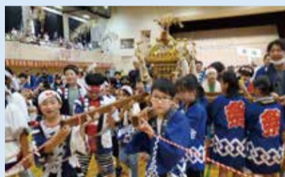
▲中之口こどもまつり