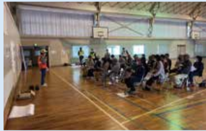
▲避難所運営説明会

【今年度の主なイベント】 健康延伸事業「なしらねえ」 健康づくり事業 「漆山地域スポーツ大会」 文化・伝承事業「漆山の歴史講座」 防災・交通安全事業 「のぼり旗の設置、自治会巡回」 地域の茶の間の開催(毎月4カ所開催)