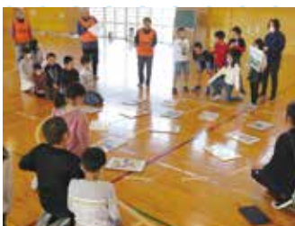
▲和納小学校「防災かるた」