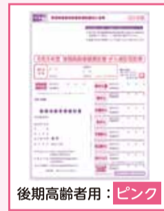
後期高齢者用：ピンク