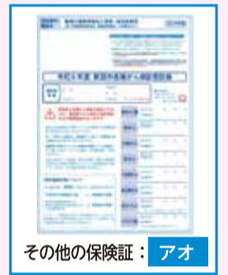
その他の保険証：アオ