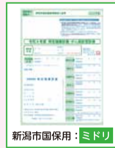
新潟市国保用：ミドリ

加入中の 健康保険証 により、 受診券が異なります 。保険証と色が合っているか確認してください。