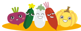
なないろ野菜キャラクター