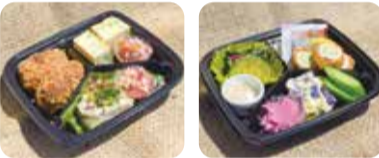
▶ 昨年度販売された総菜

7月14日(日)・15日(祝)に、松野尾地区と漆山地区の割烹による、なないろ野菜の特徴を生かした総菜を販売します(なくなり次第終了)。