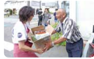
▲生産者からの野菜の寄付

7月14日(日)・15日(祝)にフレッシュフードシェアを開催します。フレッシュフードシェアとは、直売所の売れ残りや規格外などの理由から廃棄されている野菜などを拠点に集め、市内の子ども食堂に提供する取り組みです。自宅で余っている野菜などはありませんか。ぜひ持ってきてください。