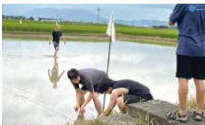
▼湯東どろんこカップ

最新の応援隊募集情報は区ホームページで確認してください。「にしかん応援隊」LINE公式アカウントや西蒲区役所 Facebook 公式アカウントでも随時募集情報をお届けしますので、ぜひ友達追加をお願いします。