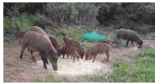
【参考】令和6年度市事業によるイノシシ捕獲頭数(令和6年9月末現在)