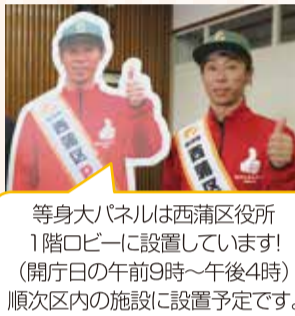
等身大パネルは西蒲区役所1階ロビーに設置しています！(開庁日の午前9時～午後4時)順次区内の施設に設置予定です。