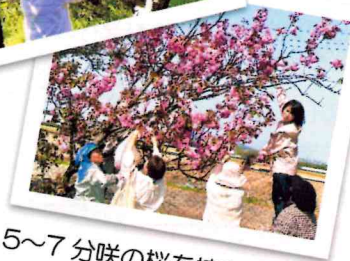
5～7分咲の桜を摘みます