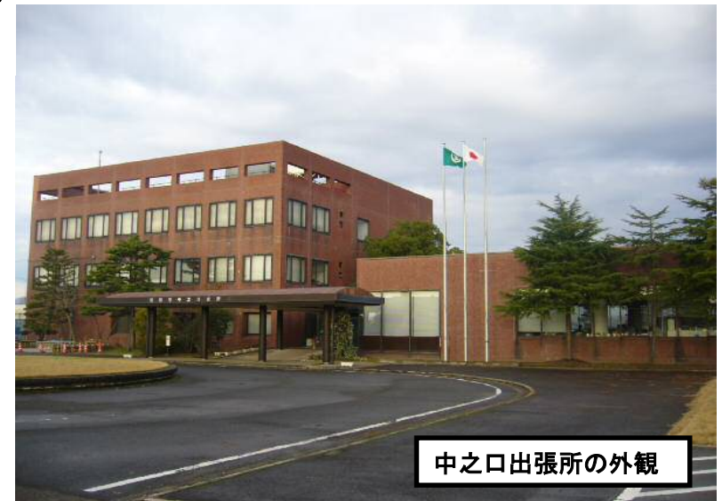
中之口出張所の外観