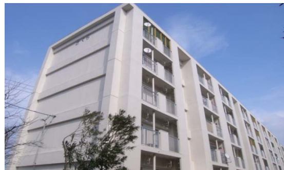
①公営住宅等ストック総合改善事業 (外壁改修工事イメージ)