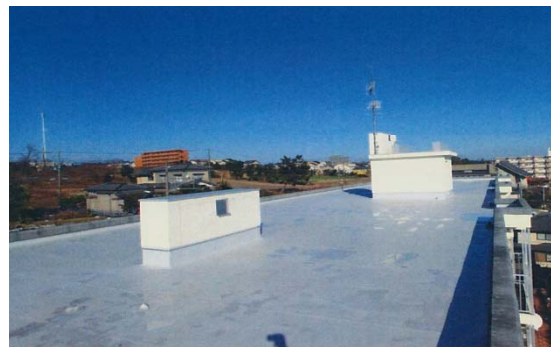
①公営住宅等ストック総合改善事業 (防水改修工事イメージ)