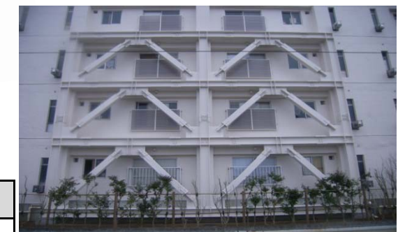
①公営住宅等ストック総合改善事業 (耐震改修工事イメージ)