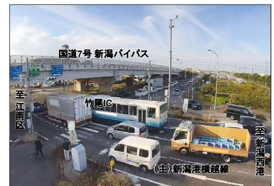
8 (主) 新潟港横越線・竹尾