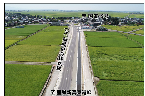
11 (主) 新潟中央環状線・浦木