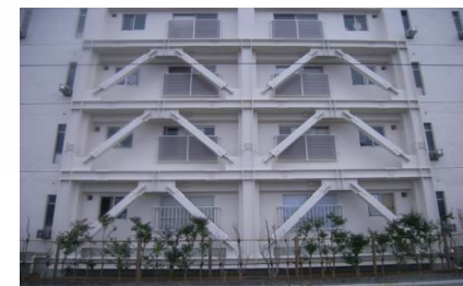
②公営住宅等ストック総合改善事業 (耐震改修工事イメージ)