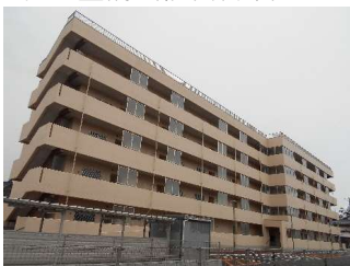
【新住棟正式名称：古町みなと住宅】