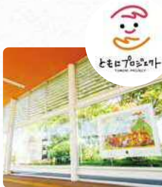
※写真は市役所前バスターミナル

障がいのある人の活動について理解を深めて頂くため、市役所前バスターミナルおよび新潟駅万代広場前に障がい者アートを展示しています。(2019年12月31日まで)