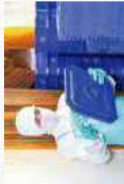
液卵やゆで卵といった鶏卵加工品の容器を洗浄。その前に、容器のひびひびのつじに貼られた商品ステッカーを丁寧にはがします。