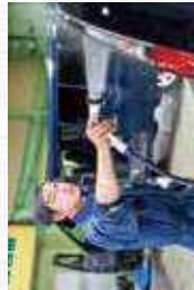
就職した当時は、なかなかできなかつた仕上げ洗車。先輩に教わったりネット動画で確認して、習得していきます。