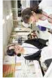
どうしてもわからないことがあれば、先輩とコミュニケーションを取りながら仕事を進めます。