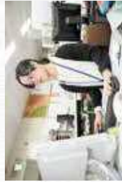
PCの入力業務も仕事の一つ。学校でも習っていたExcelを使って、社内に配属する資料を作っています。

クレーム対応で落ち込むこともありますが、仕事は楽しいです。お客様から顔を憶えてもらつて上手に対応できた時は、すごく嬉しい！社内にもっと溶け込んで、長く勤めさせていただきたいと思っています。