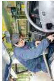
仕事はシートの手拭きや怒ふき、内装のクリーニングなど。車は大事な商品。1台1台、丁寧に作業していきます。