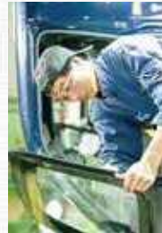
車内の汚れには色々な種類があり、それぞれに合わせてクリーニング方法できれいにしていきます。