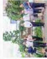
みつばち研修ツアー in 仙台