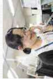
入社後2か月経ってから始めた電話対応。最初は緊張しましたが、今は先輩方の話し方を参考に、ハキハキ答えます。