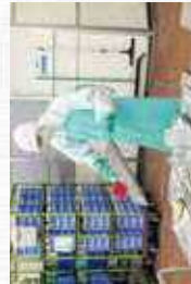
機械のパーツはたくさんあるので、ひとつひとつ丁寧に、そして手際よく洗えるようにしています。