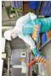
トレイに入った卵を、洗浄用の水槽に入れています。割れたりヒビの入った卵を取り除くのも、瞬時に判断。