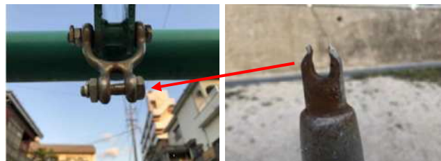
摩耗により上部がすり減り破断した吊り金具の状況（右写真）