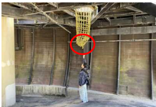
事故と同種のネット（袋状の下部が破れた）