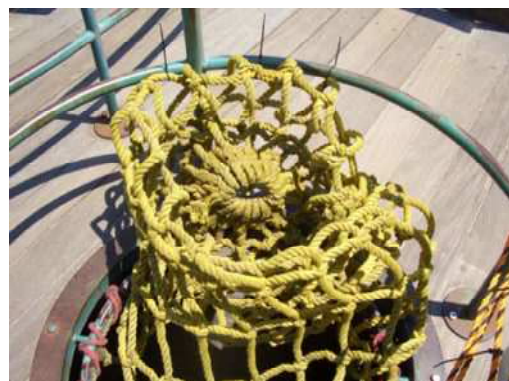
事故と同種のネット