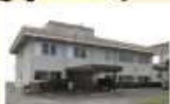
味大地区公民館 ☎025-373-4930 南區味大2676 ※事務所は味大出賃所内 ☎025-373-4788 南區味大1544