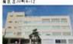
志山地区公民館(志山地区センター) ☎025-250-2930 南區志山1丁目1-12