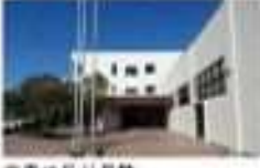
直室地区公民館 ☎0256-72-8044 西區直室168