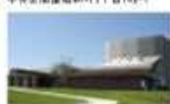
馬場地区公民館(江南文化会館) ☎025-382-3703 江南區幸野山2丁目1-14