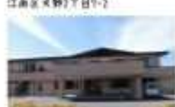
榎越地区公民館 ☎025-385-2043 江南區いぶき野1丁目1-2