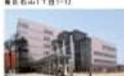
中央公民館・生涯学習センター (クロスビルに隣接) ☎025-224-2068 中央區御幸通2ノ町2655