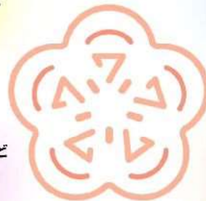
新潟市公民館のシンボルマーク

運動や音楽、学習会など サークル活動に 利用できます。 (約4,000団体が 活動しています)