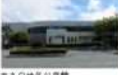
中央口地区公民館 ☎025-379-5006 西區中央口118