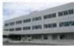
大地地区公民館 ☎025-387-1761 北區和泉1丁目1-1