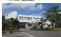
片海地区公民館 ☎025-373-1200 南區片海11