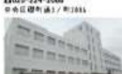
魚屋野地区公民館(南地区センター) ☎025-285-2371 中央區和泉1丁目1-1