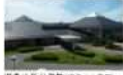
湯巻地区公民館(湯巻市庁舎) ☎0256-86-2311 西區北山14