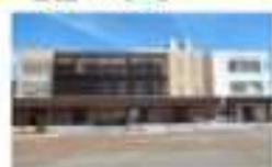
小湊丹まちづくりセンター (小湊丹地区公民館) ☎0250-25-5715 新津區小湊丹126-1