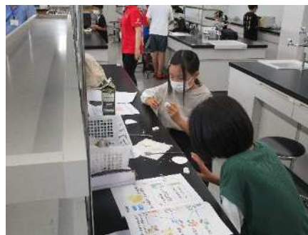
②チャレンジあきは体験隊 7/23 牛乳でキーホルダーづくり(新潟薬科大学)