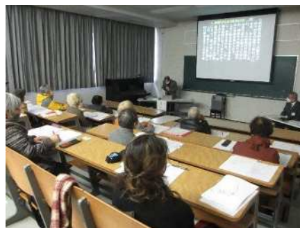
⑨古典入門講座 11/30、12/7 越後ごぜの語り唄を文学として鑑賞