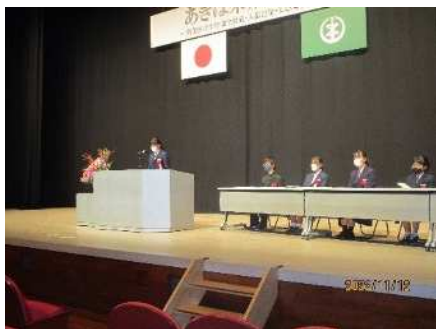
①あきは未来フォーラム 11/12 中学生による「私の主張」発表