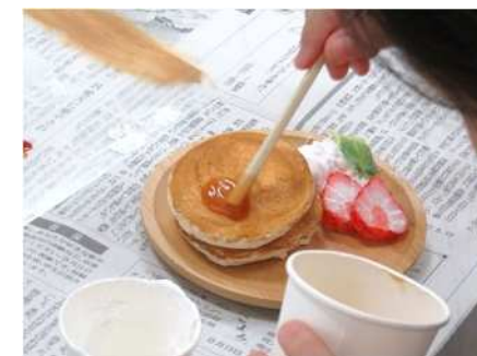
⑱食品サンプルを作ろう！ 8/24 プチパンケーキとクリームソーダづくりを実施