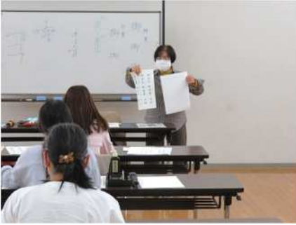
㉒ブチ書道教室 11/11、18 宛名書き、年賀状の書き方の学ぶ