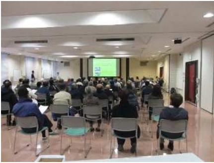
①コミ協出前講座(桂家歴史講座) 10/15、12/17、2/18 中央コミ協と連携