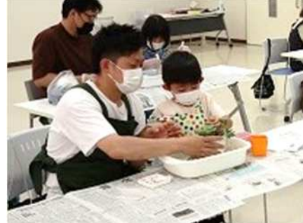
⑪みどりの植物を楽しもう 5/14、6/11 苔玉作り、多肉植物の寄せ植えを実施