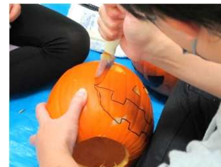
⑭ハロウィン読み聞かせ&カボチャランタンづくり 10/15 読み聞かせとカボチャランタンの制作