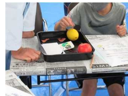
⑰やってみよう科学実験 8/24、25 指紋の跡を見つけたりスライムづくりを実施