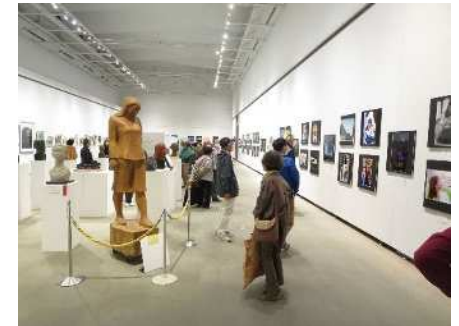
㊤秋葉区美術展覧会 10/15～23 267点が出品され、1,912人が観覧