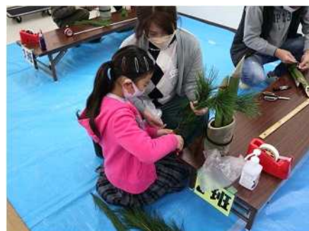
⑥ミニ門松づくり 12/17 子どもと保護者でミニ門松づくりを実施