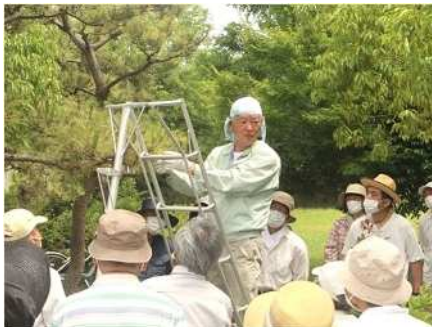
②庭木剪定講習会 6/26 病虫害予防とクロマツの剪定を実施