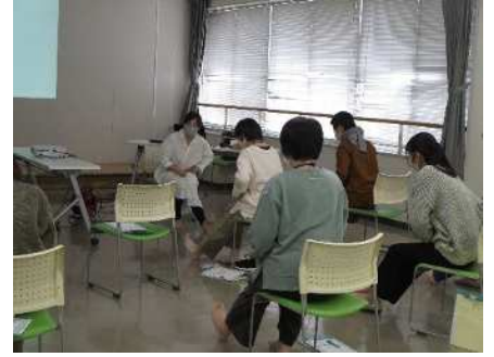
⑦児童期家庭教育学級 11/8、11/15、11/22 家族でできる足指トレーニング