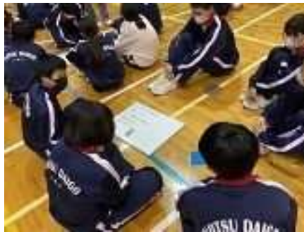
④GIP 集会(新津第五中学校) 11/24 いじめ防止・解消のための学年縦割りの話し合い