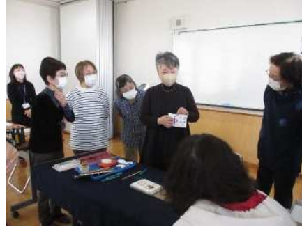
㊤書道入門講座 11/4、11/11、 11/18 小筆でデザイン年賀状づくり