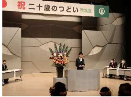
㊤秋葉区二十歳のつどい 5/3 18歳成人 移行後はじめての開催