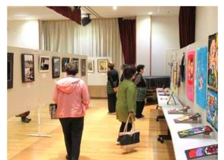
㉔小須戸地区市民展 10/29、30 小須戸地区の住民による作品展示