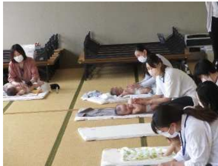
⑤ゆりかご学級 5/20、5/27、6/3、6/9、6/16 ベビーマッサージ