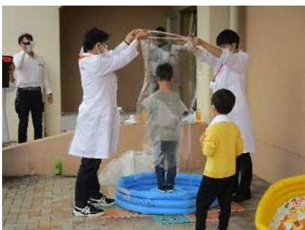
④子ども創造塾(新関小学校) 10/15 新潟薬科大学によるシャボン玉づくりほか