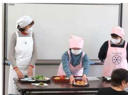
㉓健康教室 11/29 食生活改善推進員による 栄養指導と塩分測定を実施