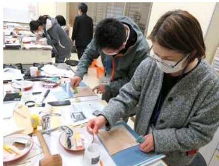
⑤はじめてのレーザークラフト体験会 12/16 革を使ったペンケースを制作