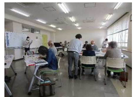
⑦シニアライフ講座(スマホ講座) 6/7・14、9/15・22、10/13・20、11/29・12/6