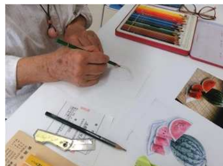
④楽しい いろえんぴつとパステル 8/10、17 色鉛筆とパステルで着色体験、ポストカードの作成