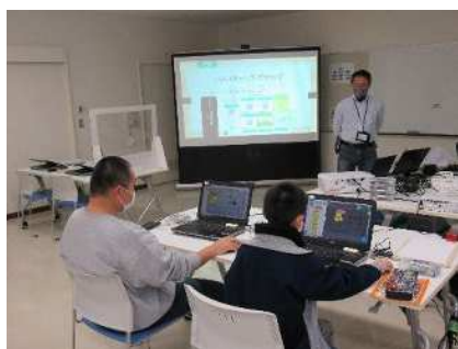
⑧子どもとおとなのプログラミング体験会 1/30 新大とボランティアによる体験会