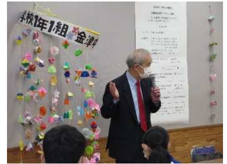
③地域交流事業(金津中学校) 1/13、1/16、1/18 つるし雛づくり