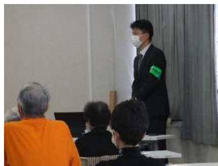
⑥シニアライフ講座(社会学講座) 10/19、10/26、11/2 「特殊詐欺を防ぐ」ほか