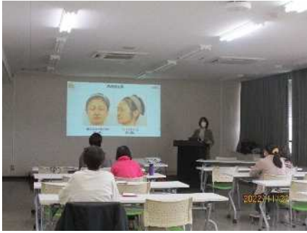
㊤女性セミナー 11/20、11/27 メイク UP ビューティー講座