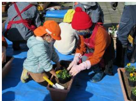
①花いっぱい運動 5/19、10/26、11/18、12/23 学校と地域の協働植栽作業