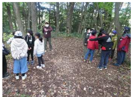
③あきはつ子里山体験隊 11/6 秋葉公園でネイチャーゲーム