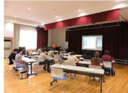
⑫家庭教育講演会 7/20 大阪にいる講師と会場を結んでオンライン講演会を実施