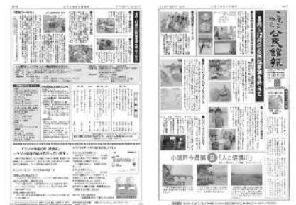
㉗こすど地区公民館報の発行 毎月15 日発行 地域の話や情報を紹介