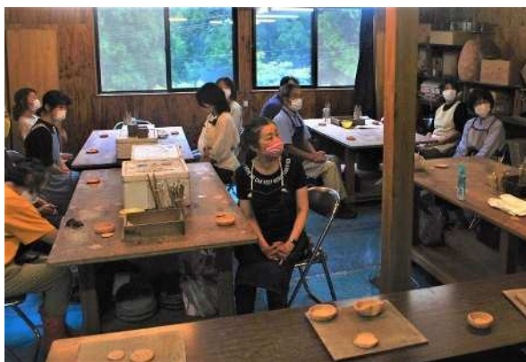
※令和4年度 陶芸教室の様子