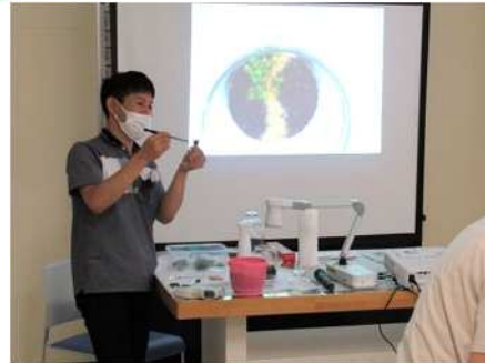
③苔テラリウムを飾ろう！ 7/17 ポットの中に苔テラリウムを制作