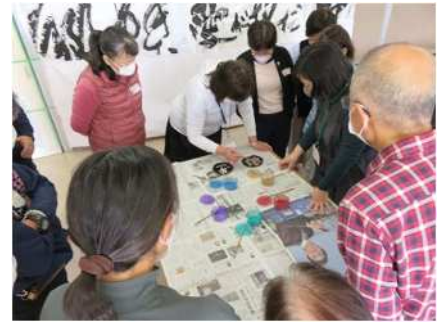
㉑新津南高校学校開放講座 9/24、10/8、22、 11/12、19 高校教師による学校開放講座