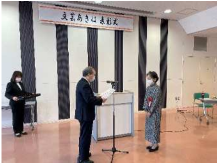
㊤秋葉区文芸区民大会 11/19 「文芸あきは」 優秀作品の表彰