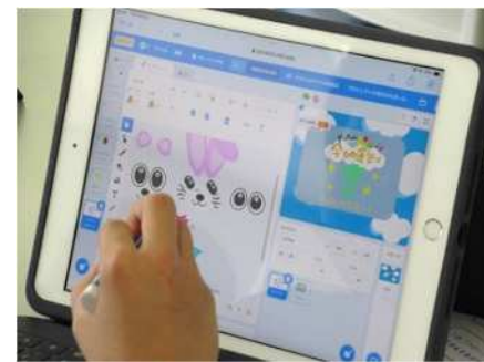
⑮子どもプログラミング教室 7/23 プログラミングツールでゲームを制作