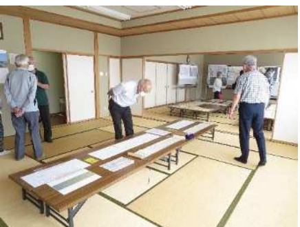
⑧秋葉区の学び 6/14、6/21、6/28 秋葉区の発展に尽力した「本間家と本間新作」を学ぶ