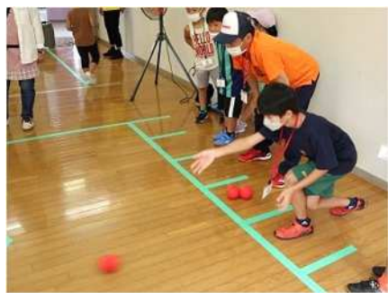
⑯夏に負けないスポーツ体験 8/9 カーリンコン、ボッチャを実施