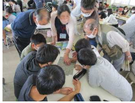
②コミュニティ防災学習会(阿賀小学校) 6/18 コミ協と一緒に災害時の行動を考える