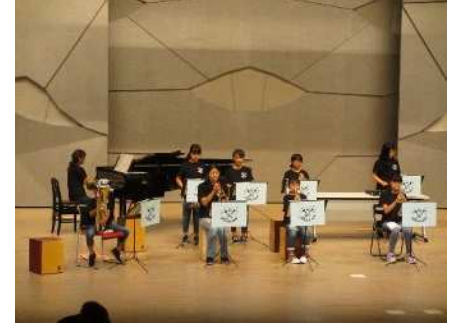
㊤秋葉区芸能祭 6/26 3年ぶりに有観客で 開催