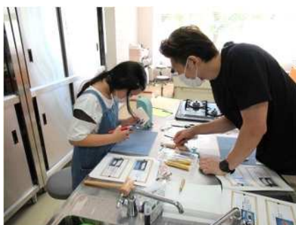
⑬親子レーザークラフト体験会 10/1 革を使った三角コインケースを制作