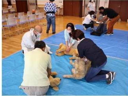
⑳ペットと防災 7/3 ペットの同行避難、健康管理、応急手当を学ぶ