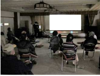
⑱リバーサイドシネマ 6/14、8/9、10/4、12/13、 2/14 小須戸老人福祉センターで映画等を上映