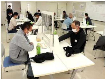
㉕小須戸地区囲碁・将棋大会 11/3 参加者の技術向上と交流を促進