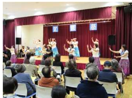
㉖小須戸地区芸能祭 11/12 小須戸地区の住民による芸能発表会