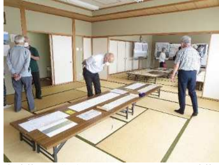
⑱秋葉区の学び 6/14、6/21、6/28 秋葉区の発展に尽力した「本間家と本間新作」を学ぶ