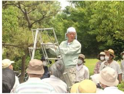
②庭木剪定講習会 6/26 病害虫予防とクロマツの剪定を実施