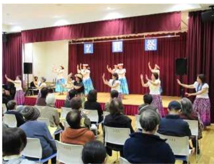
㉗小須戸地区芸能祭 11/12 小須戸地区の住民による芸能発表会