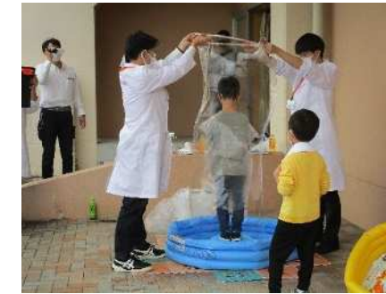
⑭こども創造塾(新関小学校) 10/15 新潟薬科大学によるシャボン玉づくりほか