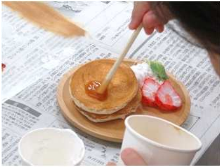
⑱食品サンプルを作ろう！ 8/24 プチパンケーキとクリームソーダづくりを実施