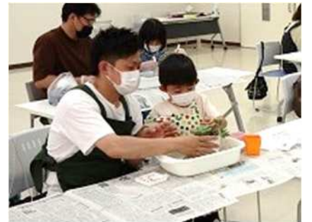
⑩みどりの植物を楽しもう 5/14、6/11 苔玉作り、多肉植物の寄せ植えを実施