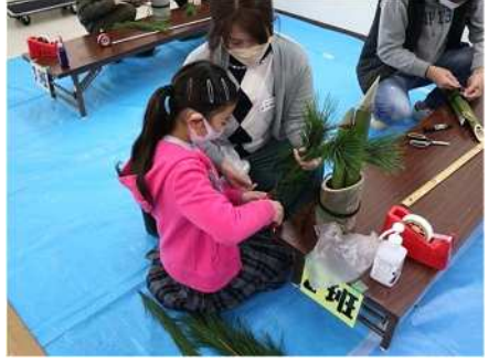
⑥ミニ門松づくり 12/17 子どもと保護者でミニ門松づくりを実施