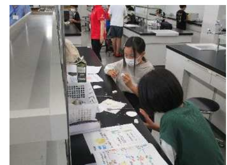
⑫チャレンジあきは体験隊 7/23 牛乳でキーホルダーづくり(新潟薬科大学)