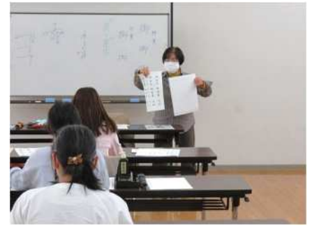
㉓プチ書道教室 11/11、18 宛名書き、年賀状の書き方の学ぶ