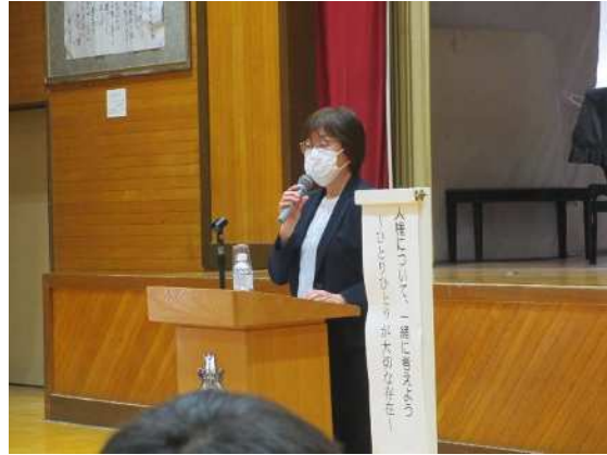
⑯中学生の人権教室(小合中学校) 5/25 「人権について、一緒に考えよう～ひとりひとりが大切な存在～」 自分が大切にされるべき存在であることや、その実現に向けた気持ちの持ち方などを講演しました。