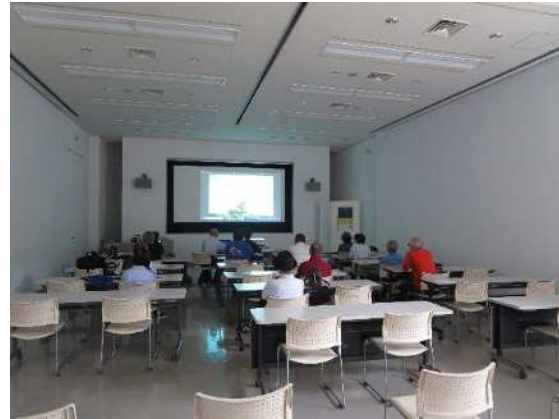
⑰新津美術協会連携事業(写真教室) 5/30、6/13、7/4 デジカメを使って県立植物園で参加者が撮影し、それを投影して解説・指導をしました。