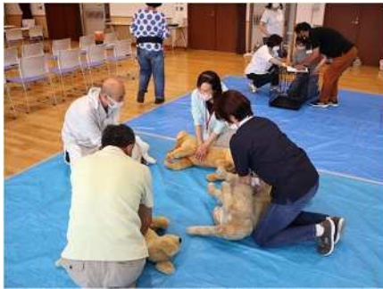
㉑ペットと防災 7/3 ペットの同行避難、健康管理、応急手当を学ぶ