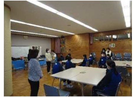
③地域交流事業(金津中学校) 1/13、1/16、1/18 つるし雛づくり