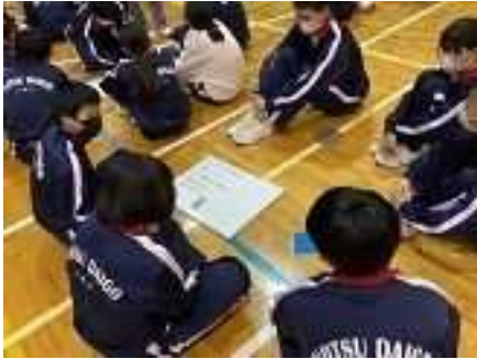
④GIP 集会(新津第五中学校) 11/24 いじめ防止・解消のための学年縦割りの話し合い