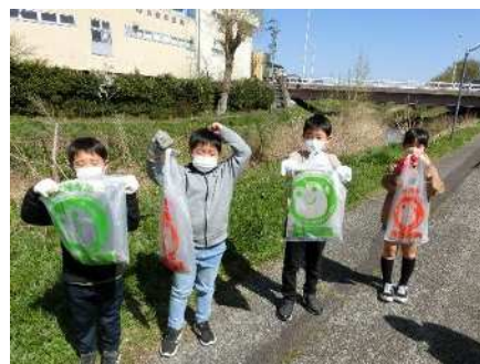
⑩秋葉区一斉クリーン作戦 4/17