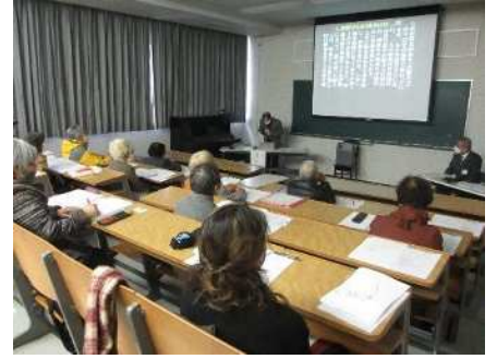
⑲古典入門講座 11/30、12/7 越後ごぜの語り唄を文学として鑑賞