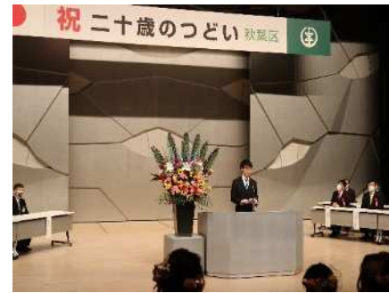
㉘秋葉区二十歳のつどい 5/3 18歳成人移行後はじめての開催