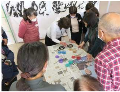
㉒新津南高校学校開放講座 9/24、10/8、22、 11/12、19 高校教師による学校開放講座