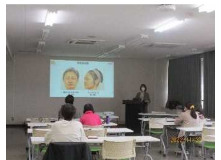
㉓女性セミナー 11/20、11/27 メイクUPビューティー講座