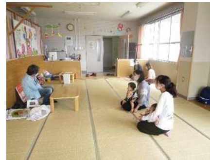
⑧子育てサロン「ポップー！」第1・3木曜日 絵本の読み聞かせ