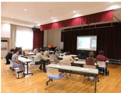
⑫家庭教育講演会 7/20 大阪にいる講師と会場を結んでオンライン講演会を実施