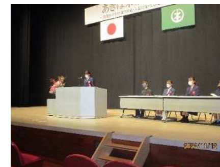
⑪あきは未来フォーラム 11/12 中学生による「私の主張」発表