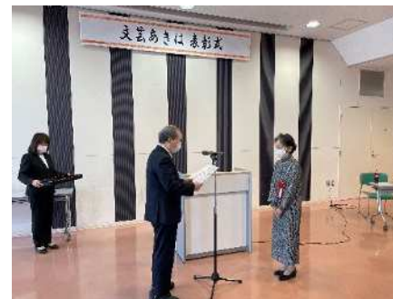
㉗秋葉区文芸区民大会 11/19 「文芸あきは」優秀作品の表彰