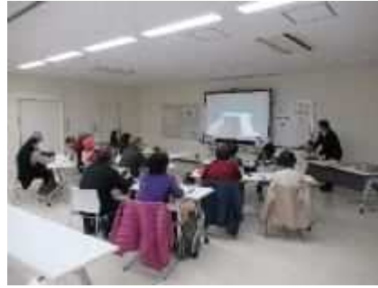
⑲シニア向けスマートフォン教室 3/7 スマートフォンの基本的な操作方法を学ぶ