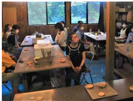
㉒新津美術協会連携事業(陶芸入門講座) 9/17、9/24、10/15