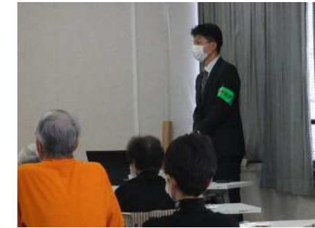
⑯シニアライフ講座(社会学講座) 10/19、10/26、11/2 「特殊詐欺を防ぐ」ほか