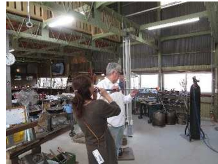
㉕ガラス工芸体験講座 3/11 吹きガラス、スタンドグラスなどの体験講座