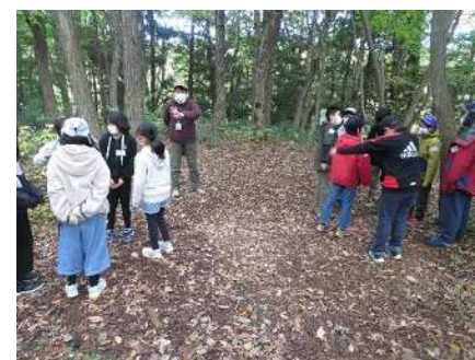
⑬あきはっ子里山体験隊 11/6 秋葉公園でネイチャーゲーム