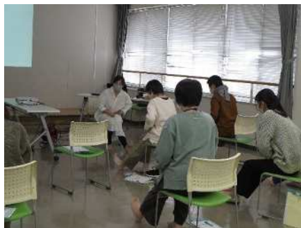
⑦児童期家庭教育学級 11/8、11/15、11/22 家族でできる足指トレーニング