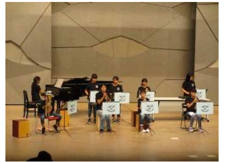
㉖秋葉区芸能祭 6/26 3年ぶりに有観客で開催