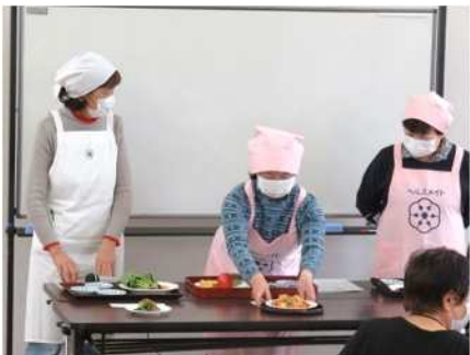
㉔健康教室 11/29 食生活改善推進員による 栄養指導と塩分測定を実施