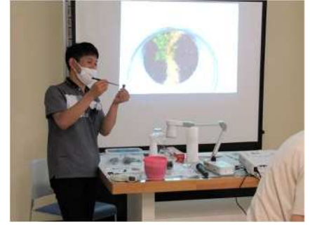
③苔テラリウムを飾ろう！ 7/17 ポットの中に苔テラリウムを制作