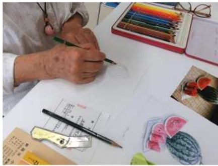
④楽しい いろえんぴつとパステル 8/10、17 色鉛筆とパステルで着彩体験、ポストカードの作成