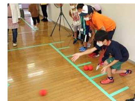
⑯夏に負けないスポーツ体験 8/9 カーリンコン、ボッチャを実施