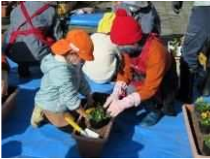
①花いっぱい運動 5/19、10/26、11/18、12/23 学校と地域の協働植栽作業