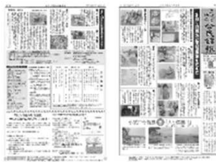
㉘こすど地区公民館報の発行 毎月15 日発行 地域の話や情報を紹介