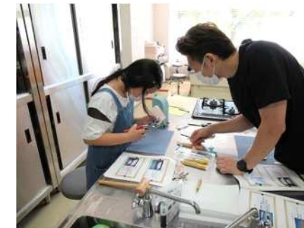
⑬親子レザークラフト体験会 10/1 革を使った三角コインケースを制作