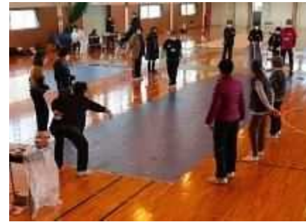
⑨第1回カーリンコン大会 3/5 小須戸コミ協と共催で初めて実施した事業