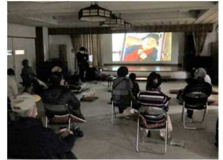
⑳リバーサイドシネマ 6/14、8/9、10/4、12/13、 2/14 小須戸老人福祉センターで映画等を上映