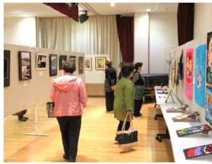
㉕小須戸地区市民展 10/29、30 小須戸地区の住民による作品展示