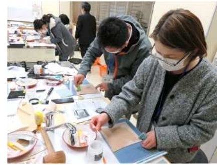
⑤はじめてのレザークラフト体験会 12/16 革を使ったペンケースを制作