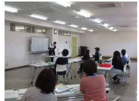
⑨保育者交流会 4/28 コロナ禍での保育対応