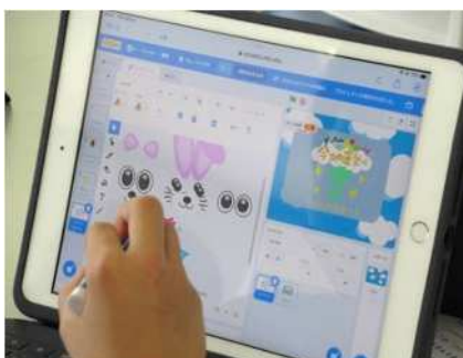
⑮子どもプログラミング教室 7/23 プログラミングツールでゲームを制作