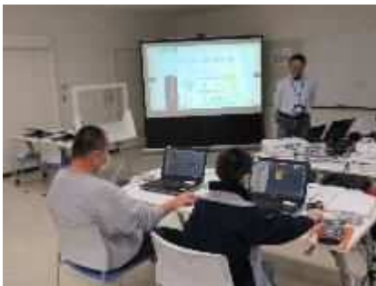
⑧子どもとおとなのプログラミング体験会 1/30 新大とボランティアによる体験会