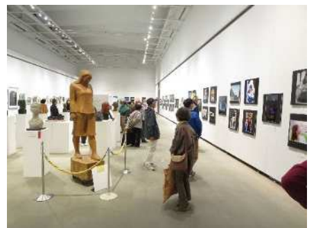
㉙秋葉区美術展覧会 10/15～23 267点が出品され、1,912人が観覧