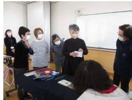
㉔書道入門講座 11/4、11/11、11/18 小筆でデザイン年賀状づくり