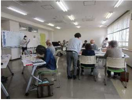
⑰シニアライフ講座(スマホ講座) 6/7・14、9/15・22、10/13・20、11/29・12/6