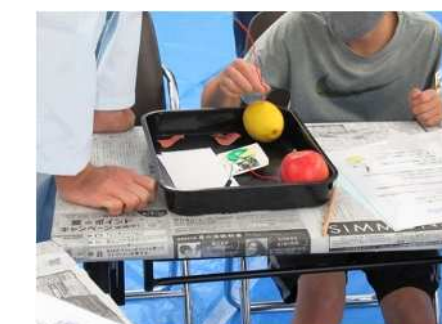
⑰やってみよう科学実験 8/24、25 指紋の跡を見つけたりスライムづくりを実施