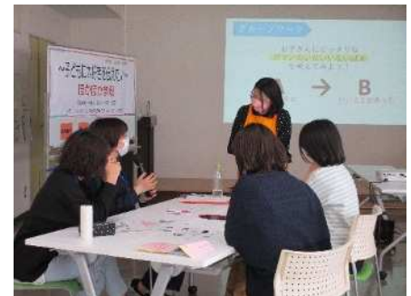
⑥ほかほか学級 10/4、10/11、10/18、10/25 脳科学でいり子育てからワクワク子育てへ