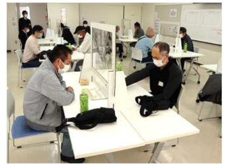
㉖小須戸地区囲碁・将棋大会 11/3 参加者の技術向上と交流を促進