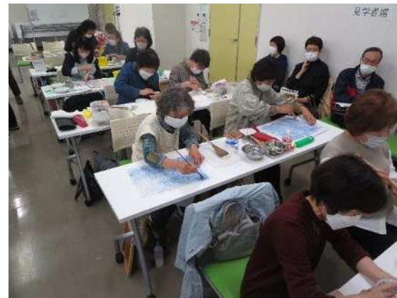
⑱新津美術協会連携事業(日本画基礎講座) 4/22 著名な講師が裏打ちなど日本画の実技指導を行い、見学者を含め多数の参加がありました。