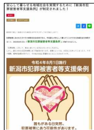
○新潟日報「ガタチラ」