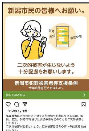
○各 SNS 配信画面

実施内容 Facebook、Instagram、TwitterなどのメジャーSNSでのターゲット指向性広告やWEBメディアによる周知を行った。