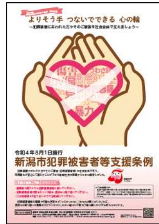
○一般向けポスター