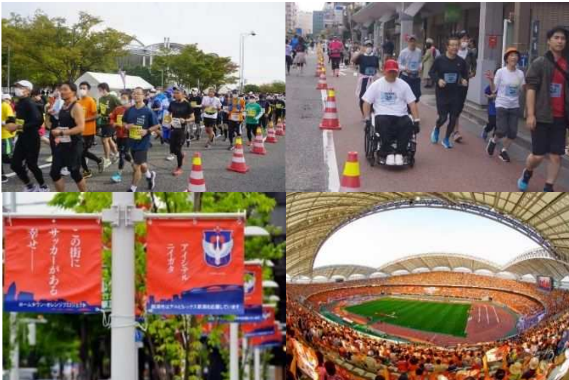
■満席のホームスタジアム

本市では、競技スポーツだけでなく、散歩やレクリエーション、野外活動も含めた身体的活動全般、さらにはスポーツを観戦したり、スポーツをボランティア活動として支えたりすることなど、スポーツの範囲については「する」「みる」「支える」スポーツとして幅広くとらえています。