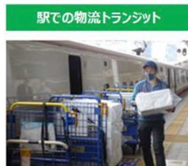
駅での物流トランジット