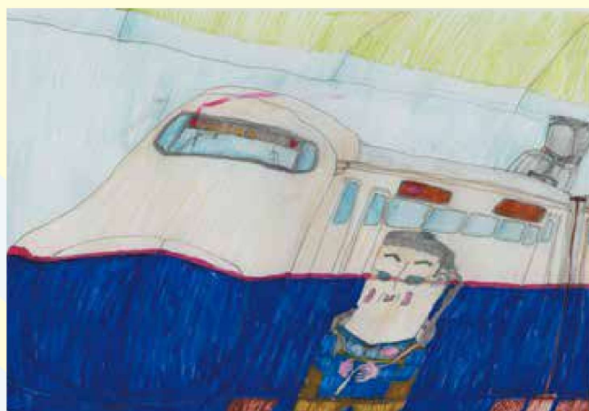
上野 恵一 <<新幹線“とき”をレポートしている少女>>