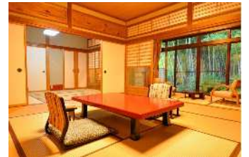
棋聖戦対局の間『常磐』