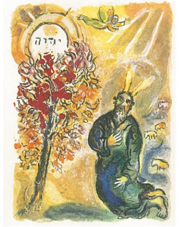
a. 『ダフニスとクロエ』屏絵 1961年刊 リトグラフ [M.308] b. 《彼は寝椅子へと上っていき、乙女が自分の髪の毛をまとい眠っているのを見出した。…》『アラビアンナイトからの四つの物語』『黒檀の馬の物語』より 1948年刊 リトグラフ [M.46] c. 《セイレンたち》『オデュッセイア』より 1975年刊 リトグラフ [M.787] d. 《それから主の使いは、茨の灌木の中から彼の方に向かって炎となって現れた。…》『出エジプト記』より 1966年刊 リトグラフ [M.447]