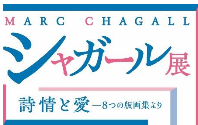
展覧会ロゴマーク（横）