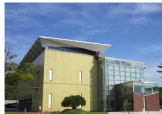
新潟市新津美術館外観