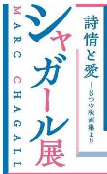
展覧会ロゴマーク（縦）