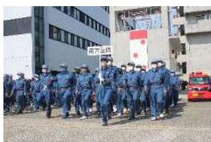
分列行進（一斉行進）