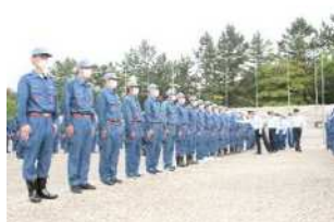
通常点検（規律の保持）