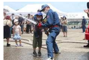
ちびっこ消防団（放水体験）