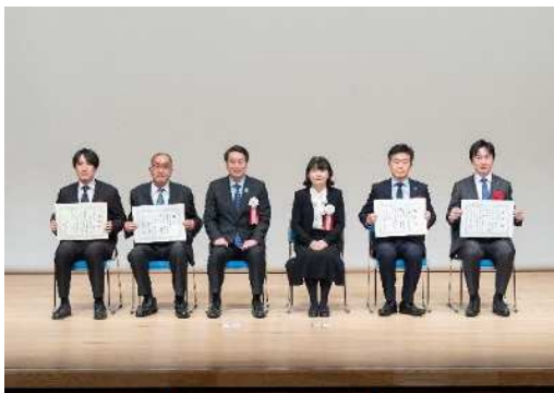
▲昨年の様子（健康経営優秀賞）