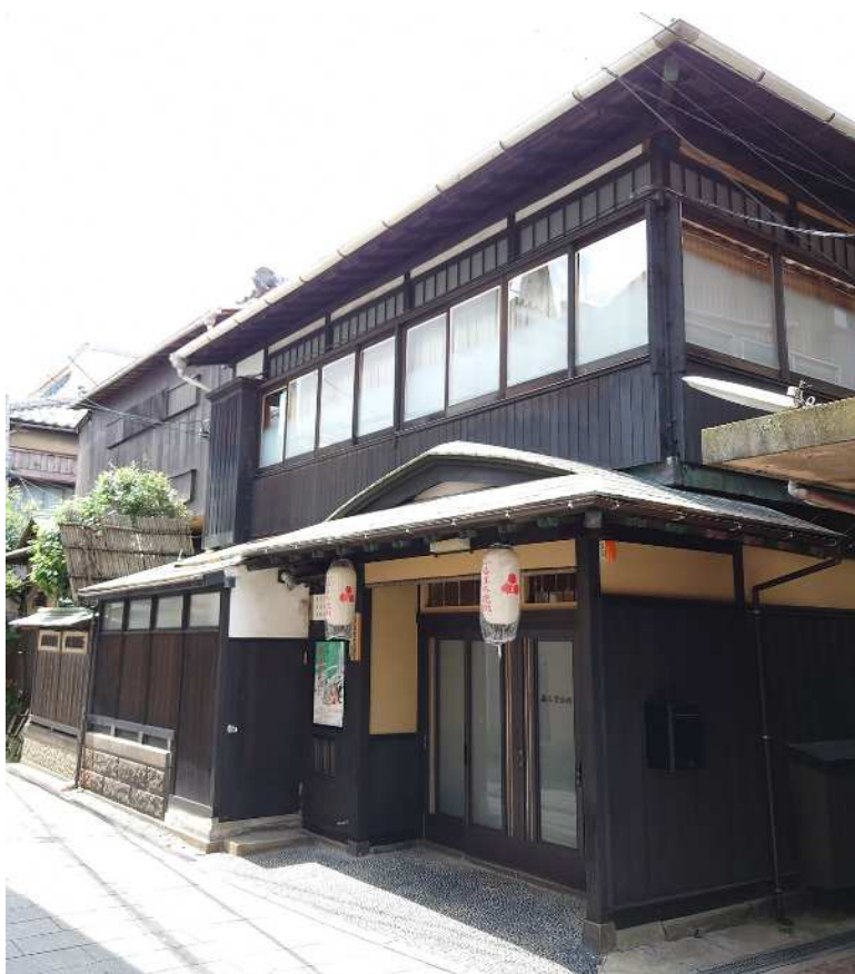
旧割烹有明表棟 外観