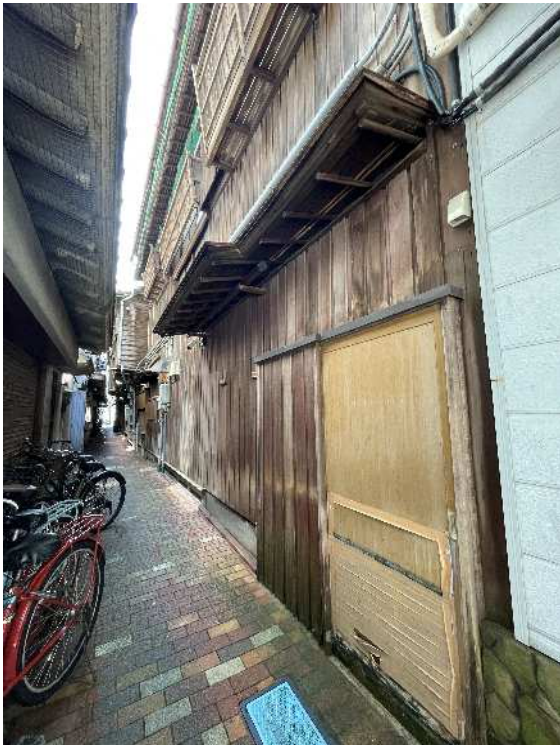
旧割烹有明奥棟 外観