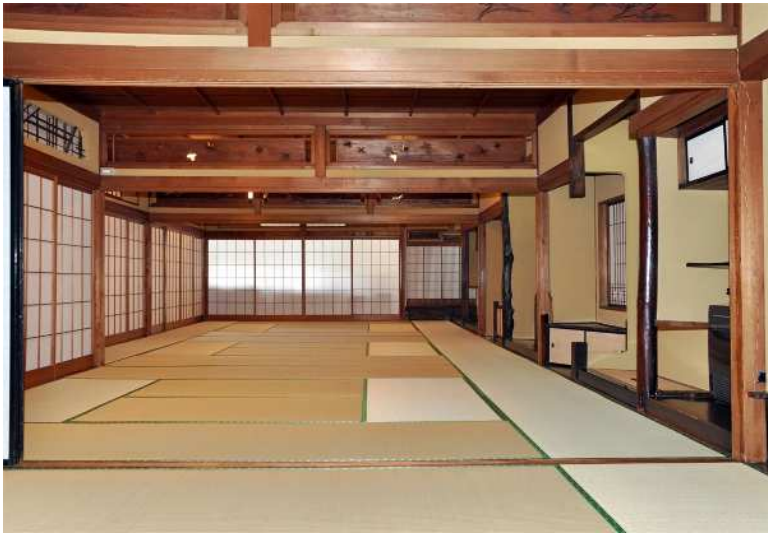
旧割烹有明表棟 二階 大広間