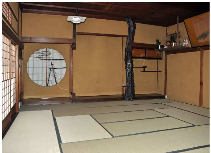
旧割烹有明中棟 二階 十壺番の間